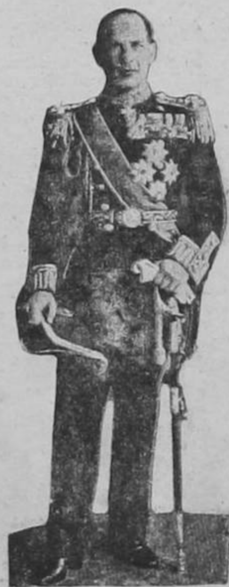
REY JORGE II, de Grecia